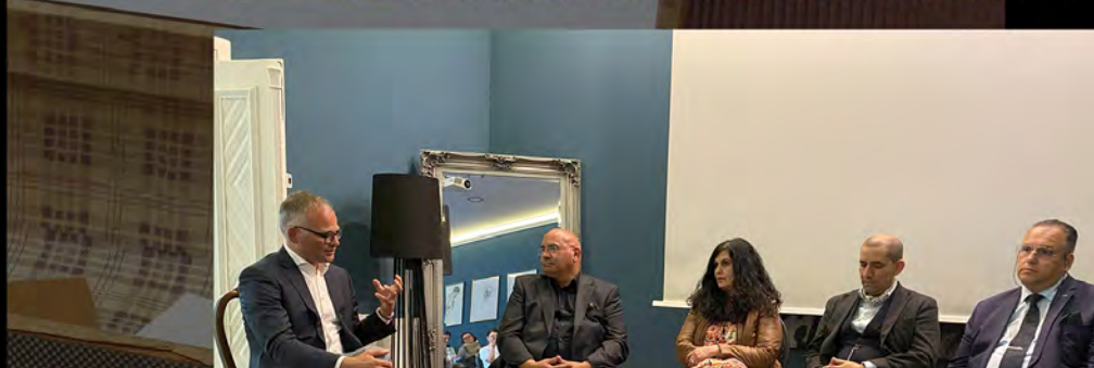
Resistance Day Festival – Wir erinnern an den Widerstand am 16.05.2023