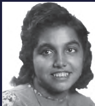
EINSATZ FÜR EUROPAS ERSTES MUSEUM DER KULTUR DER ROMA