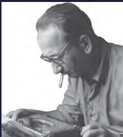
SCHRIFTSTELLER UND EUROPÄISCHER BÜRGERRECHTLICHER

WRITER AND EUROPEAN CIVIL RIGHTS ACTIVIST Matéo Maximoff was a French writer and civil rights activist. He was arrested by the Gestapo in 1943 and deported to Auschwitz-Birkenau. He was murdered in the gas chambers in 1943.