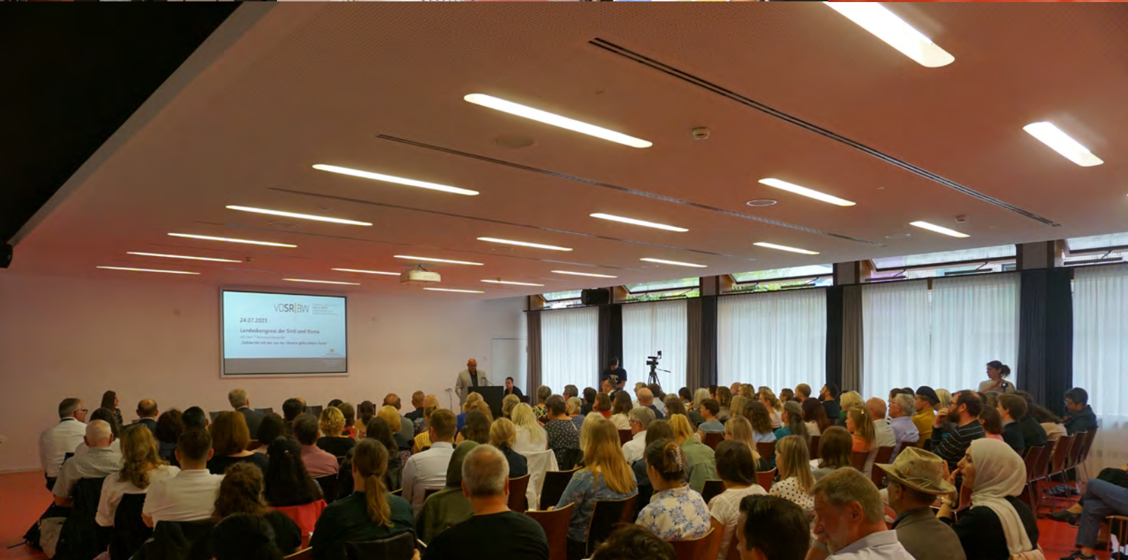
Solidarität mit den aus der Ukraine geflüchteten Roma – Landeskongress am 24.07.2023 in Stuttgart