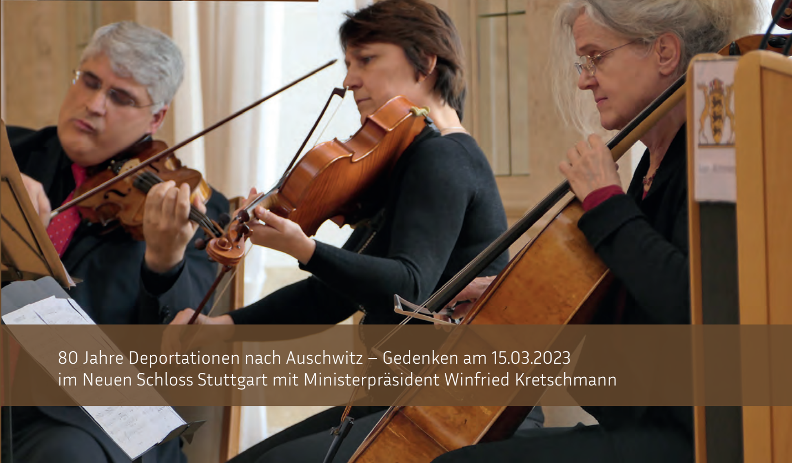
80 Jahre Deportationen nach Auschwitz – Gedenken am 15.03.2023 im Neuen Schloss Stuttgart mit Ministerpräsident Winfried Kretschmann