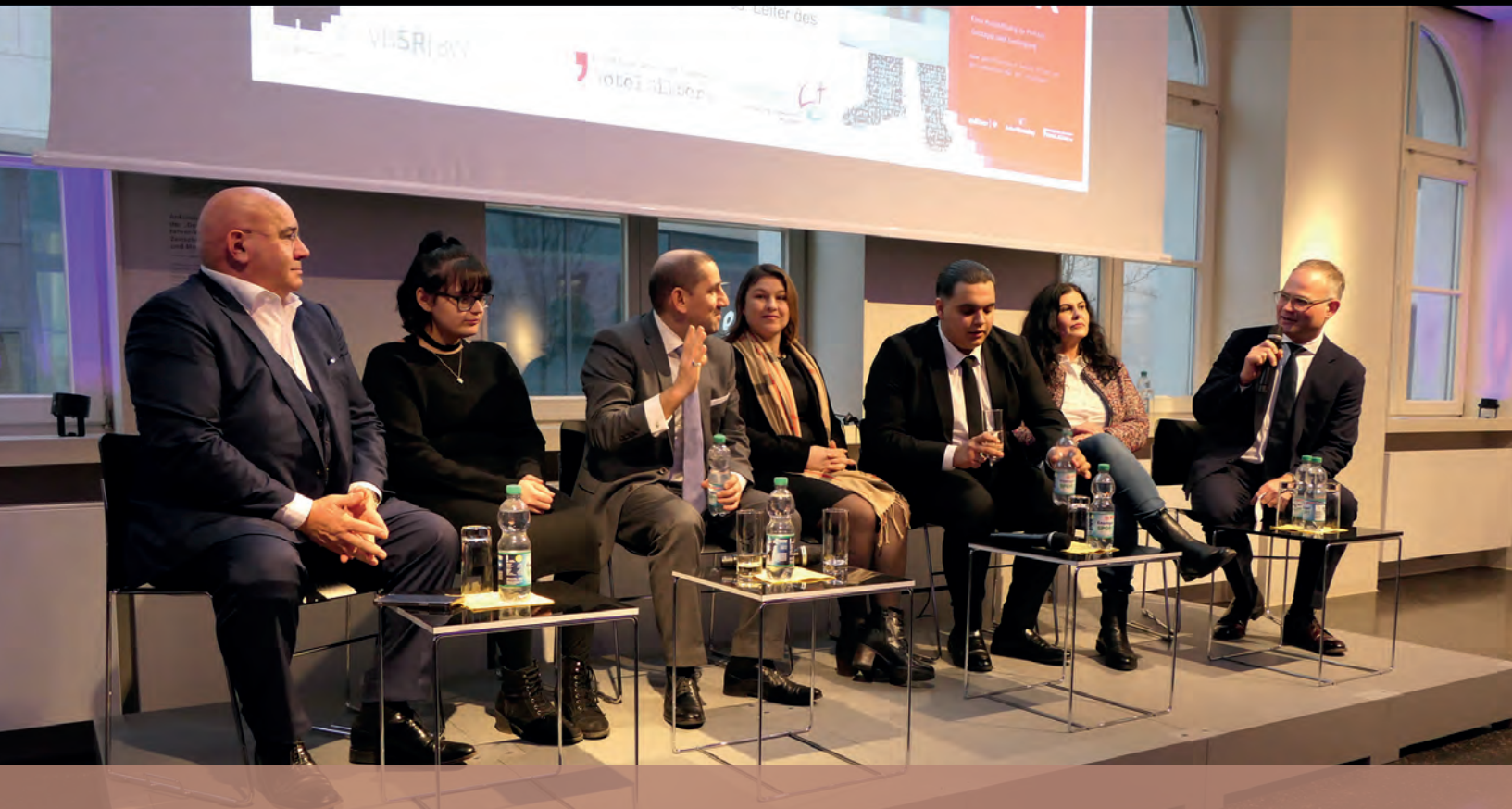
„Widerstand! Sinti und Roma im 20. Jahrhundert“ – Filmvorführung und Gespräch im Erinnerungsort Hotel Silber, Stuttgart am 27.01.2023