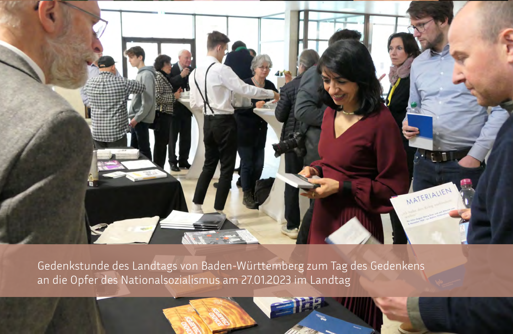
Gedenkstunde des Landtags von Baden-Württemberg zum Tag des Gedenkens an die Opfer des Nationalsozialismus am 27.01.2023 im Landtag