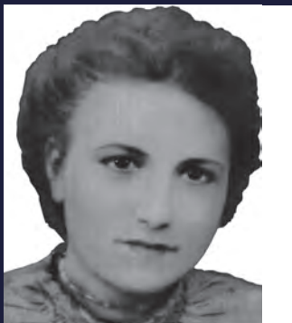
SIE WEHRT SICH GEGEN IHRE ERMORDUNG