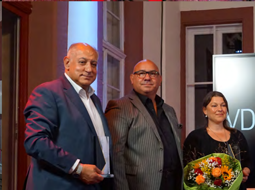
RomnoPower-Kulturwoche 2023 – Verleihung des Kultur- und Ehrenpreises der Sinti und Roma