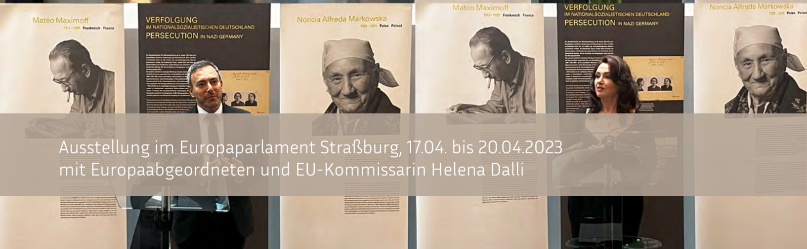
Ausstellung im Europaparlament Straßburg, 17.04. bis 20.04.2023 mit Europaabgeordneten und EU-Kommissarin Helena Dalli