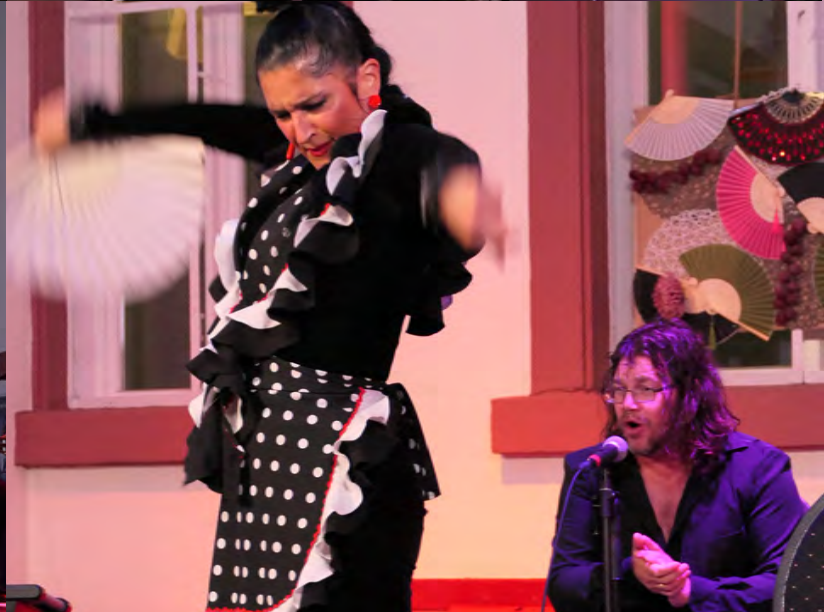
RomnoPower-Kulturwoche 2023 – Flamencoabend