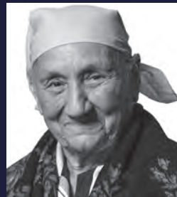
DIE PETERIN DER KINDER