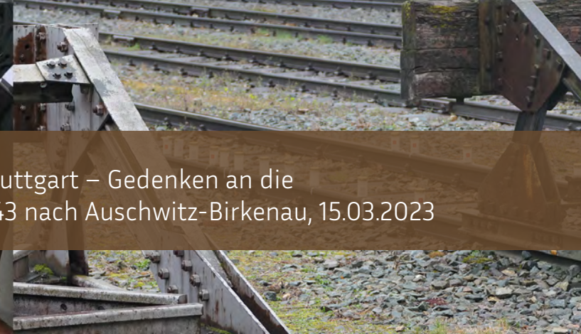
Gedenkstätte „Zeichen der Erinnerung“ in Stuttgart – Gedenken an die März-Deportationen von Sinti und Roma 1943 nach Auschwitz-Birkenau, 15.03.2023